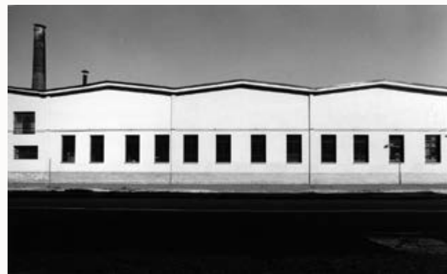
MILANO RITRATTI DI FABBRICHE

Quel giorno di primavera mi aveva rivelato una realtà che non avevo mai visto. Ricordo di essermi chiesto dove fossi e se quel luogo fosse veramente un'area della periferia milanese.