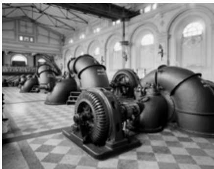
IMPIANTO IDROVORO TRAVATA (MN)

"I Ritratti di fabbriche hanno segnato una svolta radicale nel mio modo di fotografare... Le persone sono sparite dalle mie immagini e i soggetti centrali del mio lavoro sono diventati lo spazio, gli edifici, i luoghi..."