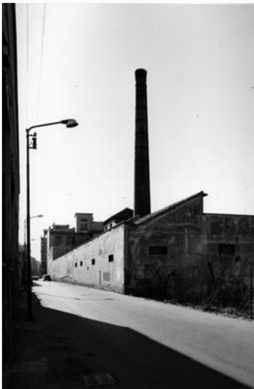
MILANO RITRATTI DI FABBRICHE